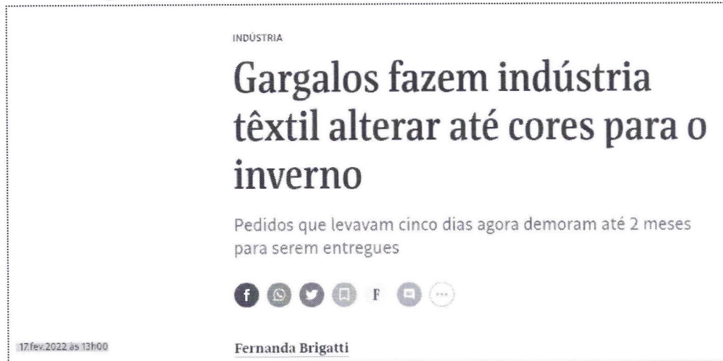
Imagem disponível no sítio eletrônico citado abaixo. 2

Sobre o tema, o Tribunal de Contas do Estado de Minas Gerais se manifestou em decisão liminar, nos seguintes processos: